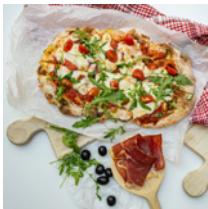
Pinsa Margherita 4500 Ft (tomato sauce, olive oil, tomato, mozzarella, rucola)