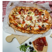
Pinsa Prosciutto e funghi 5800 Ft (tomato sauce, olive oil, prosciutto, mozzarella, mushrooms)