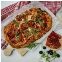
Pinsa Picante 4900 Ft (tomato sauce, olive oil, spianata calabra, mozzarella)